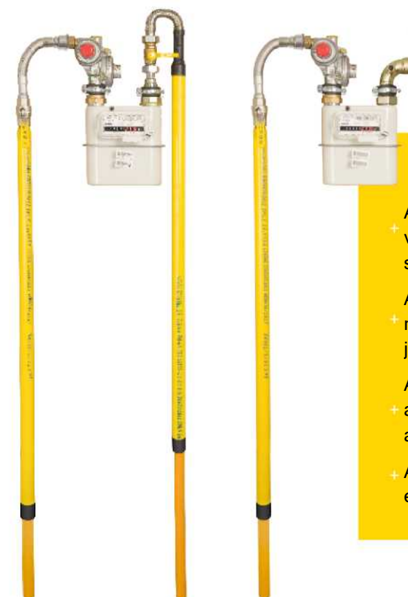
FÖLDBE VEZETŐ KIMENETI CSŐ